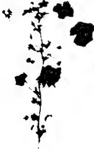
خبازة برية Malva Silvestris

وقضبانه نافع للمثانة والأمعاء، وورقه إذا مضغ نيئاً وضمد به العين نقى البواسير وأنبت فيها اللحم وأزال الغين، وإذا ضمّد به للسع النحل والزنابير نفع، وإذا دق وخلط بزبد أو تمسح به لم يضره منها ما لسع، وإذا ضمّد به مع البول أبرأ الرطبة من قروح الرأس، وإذا طبخ ودق وخلط به زيت ووضع على